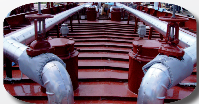
Sistema de aislamiento en válvulas (Petroquímica)