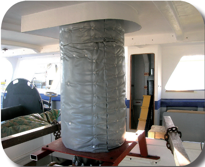
Sistema de aislamiento en Tubo de escape (Industria marina)